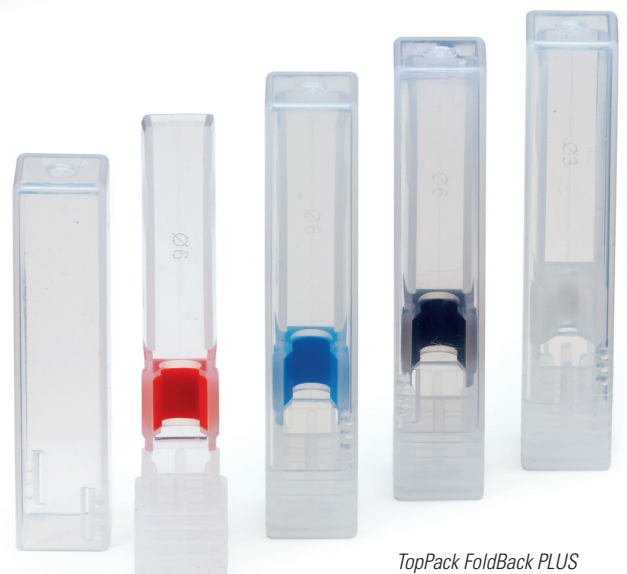
TopPack FoldBack PLUS